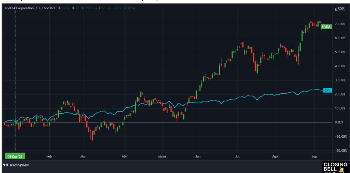
Comparativa NVDA vs Índice S&P500 (SPY)

Está claro que los excelentes resultados financieros de NVDA fueron una razón clave para explicar el aumento del 70% en el precio de sus acciones en lo que va de este año, pero de cara al futuro las perspectivas para la compañía siguen siendo positivas.